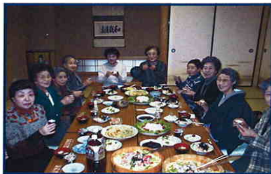
婦人会新年会にて

近年、暖冬で氷が張っている所を目にする事が少なくなりりましたが、先日、氷を目にして、ふと、思ったことですが、氷は冷たいけど、その下の水はそれほどでもない。氷は水の中のお魚さんを護っているのかなア・・・如来さまみたい！風邪が流行っています。皆さん気をつけて・・・