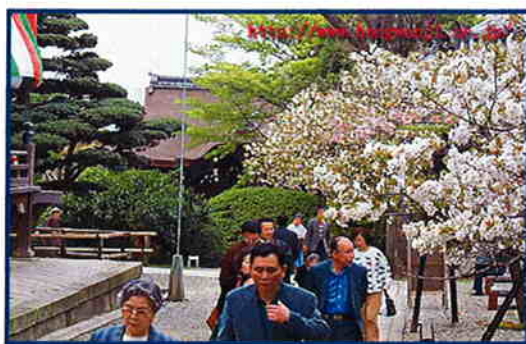
本願寺：大谷本廟（京都）