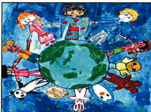
国際平和ポスターコンテスト作品より

米国人は、日本の仏壇を、家の中に教会があるという。しかし、誰もお参りする人がいないと、二度びつくり。ビツクリ。お念仏はいつでも、どこでも、だれでも持って歩くことのできる携帯用のお仏壇。南無阿弥陀仏