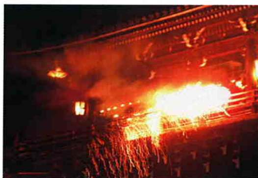
東大寺二月堂（奈良県）

冷たい寒風にじっと耐えてきた木や、草花が一斉に芽を吹き出し、虫たちも土の中から出て来て活動を始める季節となりました。古都に春を告げる東大寺二月堂のお水取りは752年以来一度も絶えることなく今年で1251回を数えるそうです。