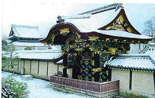
京都：西本願寺〈唐門〉

新入学生のおられる家庭では新しいランドセルを背負って喜んでいる子供の笑顔に喜びを感じておられることと思います。もうすぐ春ですね。