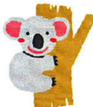
コアラも聴聞してる