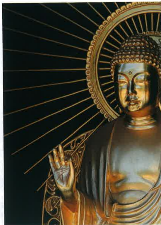
ご先祖を敬う場所、家族を思い出す場所、 いのちのつながりに感謝をする場所

お墓は代々家族で守る 大切な場所でした。 しかし現在、お墓について さまざまな悩みを持つ人が 増えています。