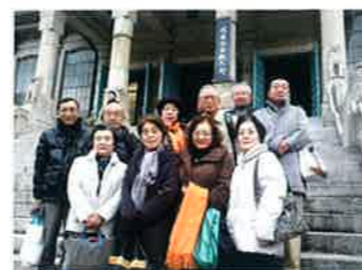
12月9日成道会参拝しました 【築地本願寺】

門信徒会に入会し、一緒に浄土真宗のみ教を聴きましょう。入会随時受付しています。毎月、寺報と仏教冊子を配布。年会費：一戸3000円