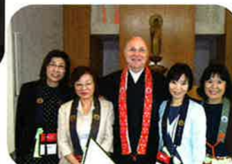
国境を越えていただいた様々なお念仏のご縁、お育てに感謝をし、これからも大切にしていきたいと思えます。坊守