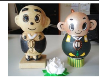
☆ようこそようこそ いらっしやい☆ お寺の玄関にご門徒さん手作りの天ちゃん 左は焼物、右はひょうたん、可愛いです

一緒に浄土真宗のみ教えを聴きませんか。入会随時受付中。 毎月、お寺のたよりと仏教冊子を配布しています。年会費は一戸三千元。