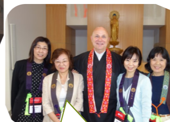
国境を越えていただ いた様々なお念仏の ご縁、お育てに感謝 をし、これからも大 切にしていきたいと 思います。坊守