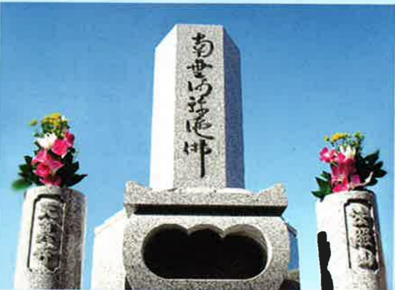
⑤墓地(大町やすらぎパーク)、合葬墓(京都と松戸)が完成