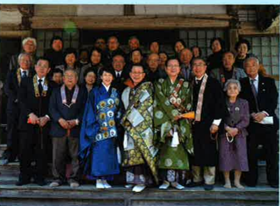
⑥今年4月8日 浄円寺にて開基300年記念法要