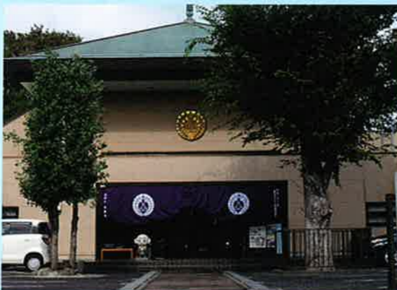
④1988(昭和63)年 現在の地・金ヶ作に移転