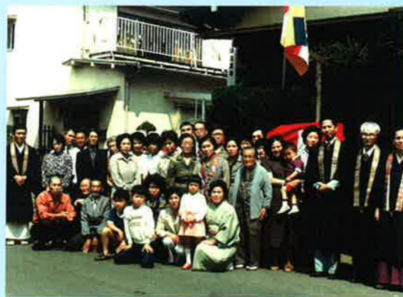
②1971(昭和45)年 千葉県松戸市に天真寺建立