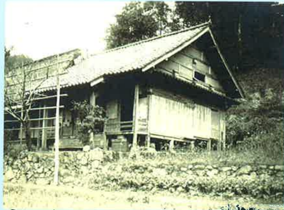
①1715(正徳5)年 島根・法照山浄円寺創建