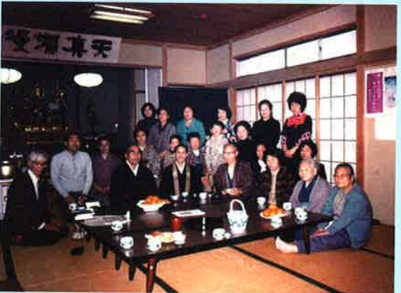
③当時の天真寺は河原塚にありました 法座後の一枚