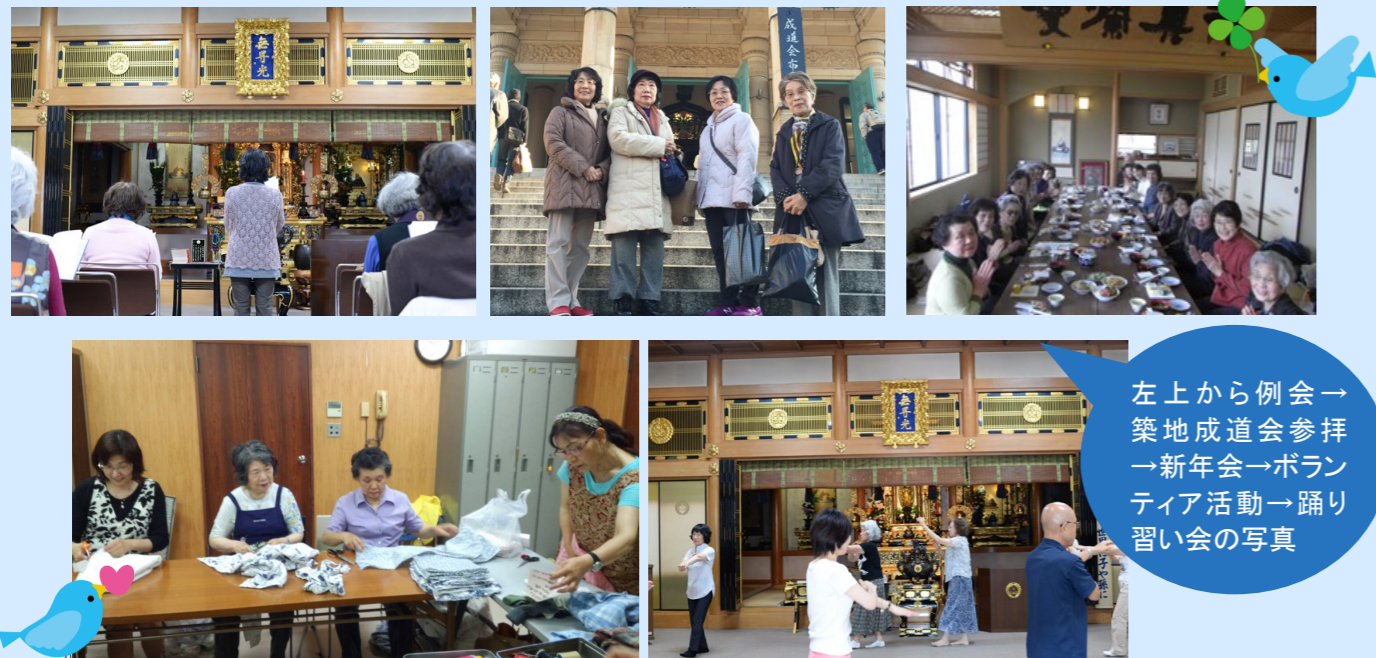
左上から例会→ 築地成道会参拝 →新年会→ボラ ティア活動→踊り 習いの写真