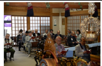
総会のお参りの様子 永代経の報告は次号で

浄土真宗 本願寺派 天真寺 〒270-2251 千葉県松戸市金ヶ作106番地 TEL 047-389-0808 FAX 047-389-0809 www.tenshin.or.jp