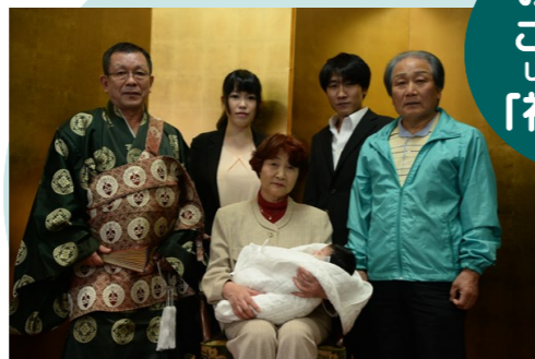
おめでとう ございます しよさんしき 「初産式」

なにの造作もなく、一心一向に如来をたのみま ぬらす信心ひとつにて、極楽に往生すべし。