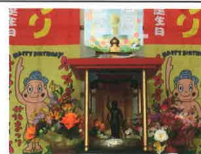
花まつりを花御堂でお祝いしました♪