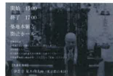
2/15築地本願寺「涅槃会布教大会」が開催。その案内に副住職の姿を発見!(^^)!